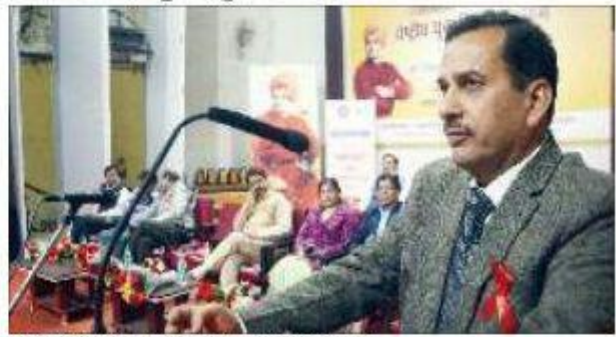
Designated authority addressing gathering of Red Ribbon Clubs.

thanked youth for the increasing rate of blood donation in the State.